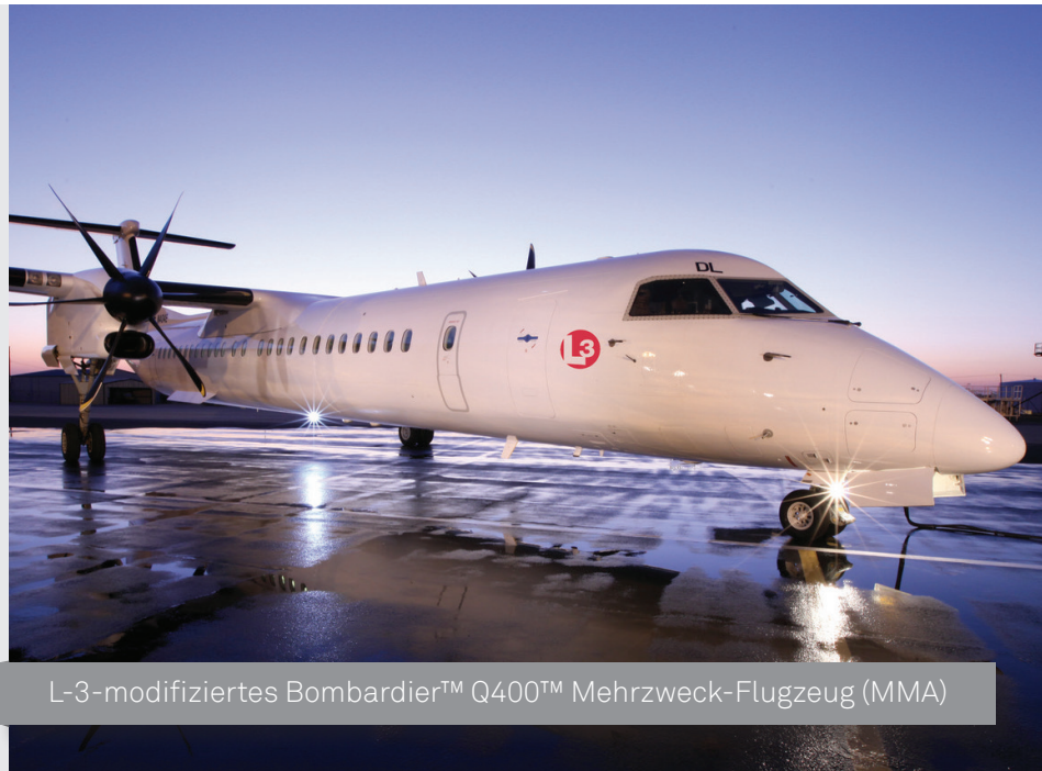
L-3-modifiziertes Bombardier™ Q400™ Mehrzweck-Flugzeug (MMA)